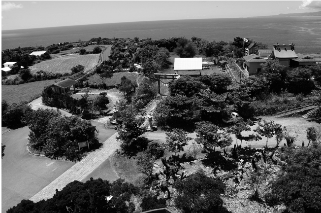
▲サザンクロスセンターより眺める与論城跡

鹿児島県の与論島と聞くと、百合が浜に代表される海の綺麗な鹿児島県最南端(沖縄県と間違われることも)の離島というイメージの方が多いのではないだろうか。もし、与論島に來られたことがある方なら、海だけではなく、島の高台にある琴平神社、地主神社や隣接するサザンクロスセンター(与論町の観光ガイド施設)から望む、沖縄島や伊平屋島、伊是名島の眺望を記憶に留めた方も多いと思われる。しかし、この琴平神社がある場所こそ今回私が紹介させていただく与論城跡(与論グスク)である。